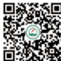
江西省水力和新能源发电工程学会 微信公众号