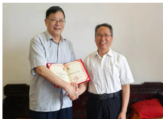
(水新学会走访江西水电及电力战线部分老科技工作者，聘请担任名誉职务并颁发聘书)