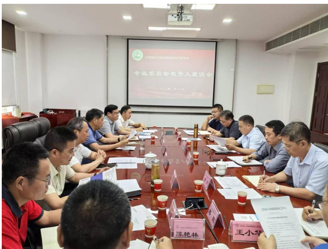
(江西省水力和新能源发电工程学会专业委员会负责人座谈会)

与会人员 and 科技工作者就专业委员会学术研讨等业务工作如何开展献计献策、畅所欲言，特别是服务会员、服务行业、服务政府、服务社会等方面，专委会需要发挥自身优势，群策群力、有所作为。并就加强专委会自身组织建设、制度建设和学术研究、科普宣传等内容，提出了建设性意见和设想。