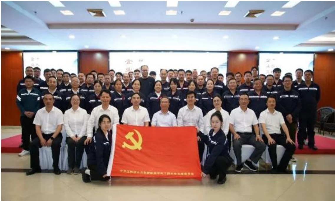
(水新学会与水电检修公司开展党建联建活动)

“水检人”在水电与新能源行业建设、生产、管理的正能量，诠释了水检人“扛着党旗闯市场”和“三千”“三特”“三精”企业文化精髓。