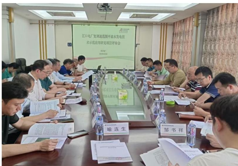
∴ (江口水电厂宽调速范围平流水发电技术示范应用研究项目评审会)

5月9日，江口水电厂宽调速范围平流水发电技术示范应用研究项目评审会在该厂生产区(新余市仙女湖区管委会江口村)举行。评审会由新余市发展和改革委员会主办，江西省水力和新能源发电工程学会作为专家评估机构协办会议。新余市仙女湖区水利局、农村农业局、