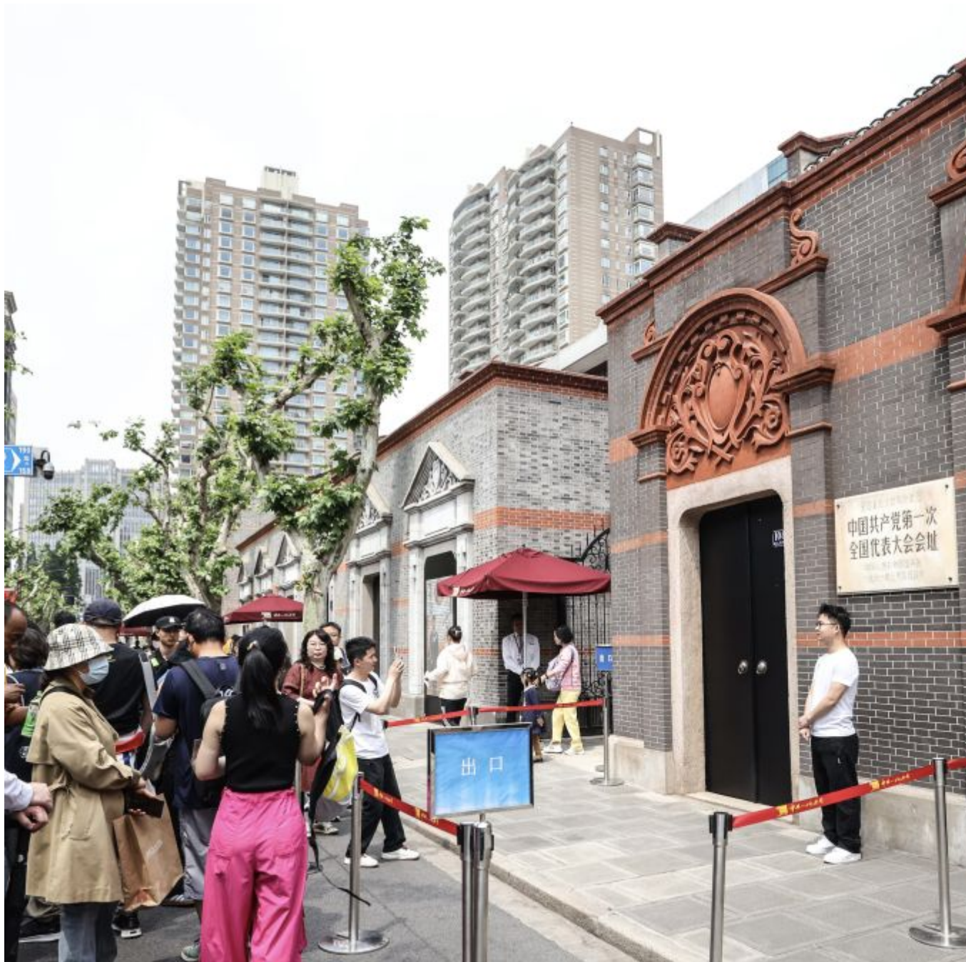
2025年5月1日，游人在位于上海的中共一大会址前留影。

知所从来，思所将往，方明所去。在历史与未来的交汇点上，新时代中国共产党人不忘初心，满怀信心，步履铿锵再出发。