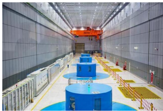
(洪屏抽水蓄能电站厂房)

洪屏抽水蓄能电站被誉为深山里天然的绿色“超级蓄电池”和华中电网最大“蓄电池”，是江西电网的“调节器”“稳定器”“充电宝”。每年可替代标煤 11.5 万吨，减少二氧化碳排放量 25.3 万吨，