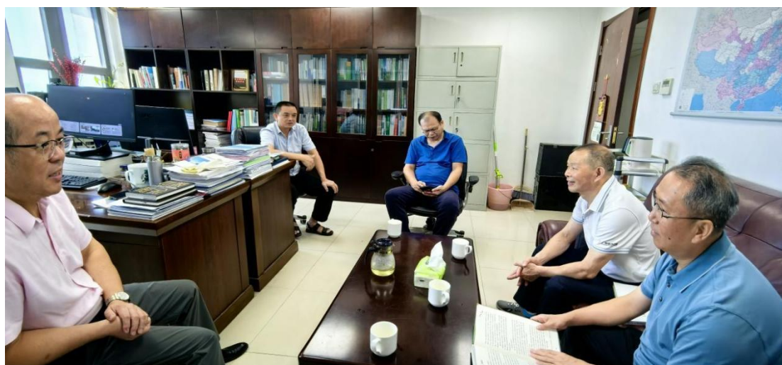
(水新学会与江西省林学会座谈交流)