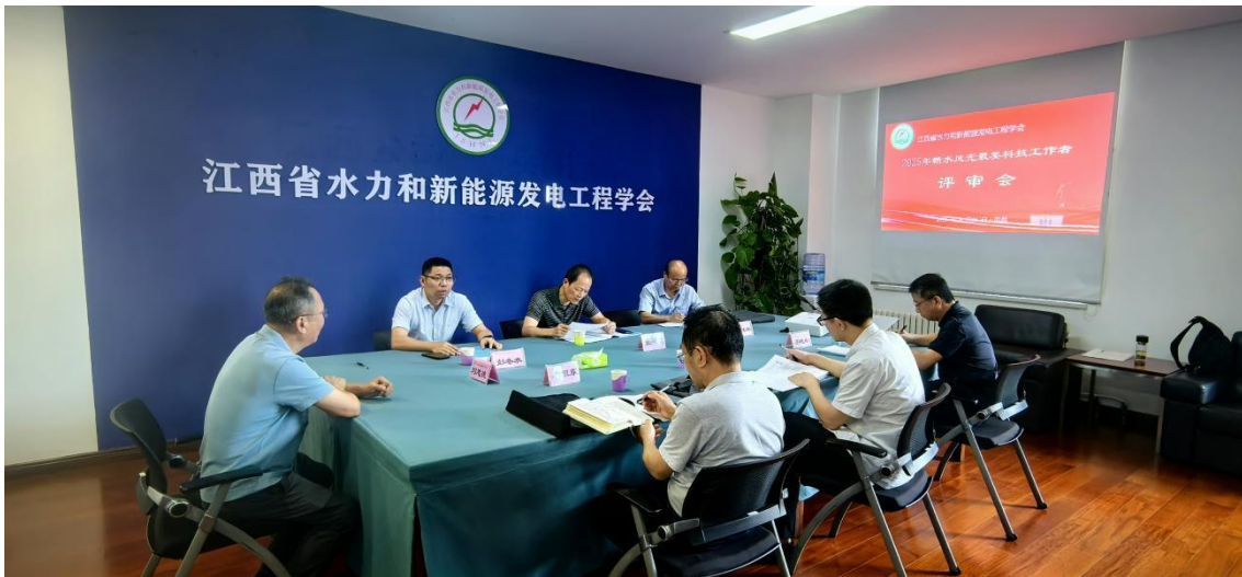
(2025年江西省赣水风光“最美科技工作者”评审会)

3月底，水新学会印发《关于开展2025年江西省赣水风光“最美科技工作者”推荐评选和宣传学习活动的通知》。7月初，印发《赣水风光最美科技工作者评选办法》。8月中旬，水新学会秘书处对单位会员推荐的“最美科技工作者”候选人的工作业绩和事迹材料，进行了初评初审。