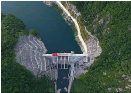
(洪屏抽水蓄能电站大坝)

洪屏抽水蓄能电站上水库利用天然高山盆地修建，四周环山，集水面积达 6.7 平方千米，总库容为 3077 万立方米；下水库利用天然河道修建，总库容为 6316 万立方米。上下水库落差 550 米，发电水头高。洪屏抽水蓄能电站可逆式抽水蓄能机组具有双向旋转、启停迅速等特点，可将电网负荷低谷时段多余电能，转变为电网高峰时段高价值电力，可消纳风电、光伏等新能源电量，对稳定江西电网结构具有十分重要的作用。